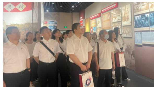
别荣获高新区2023年“五星级党组织”荣誉称号。

在上级党委的关心、支持下，山东诚信管理党支部、招标造价党支部、电网能源党支部、特高压海风党支部加强组织建设，创新工作水平，提升工作能力，党建各项工作再上新台阶，受到各级党委的高度认可，四个党支部部分